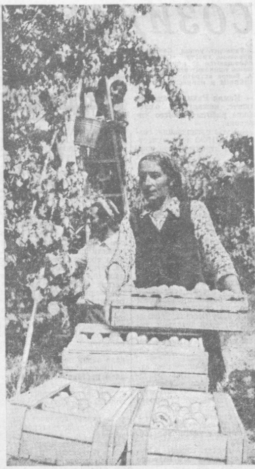
Сбор урожая абрикосов в саду.