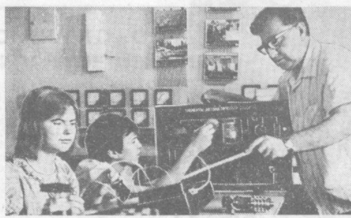
ГОСУДАРСТВЕННЫЙ КОМИТЕТ СОВЕТА МИНИСТРОВ УЗБЕКСКОЙ ССР ПО ПРОФЕССИОНАЛЬНО-ТЕХНИЧЕСКОМУ ОБРАЗОВАНИЮ

на дневное отделение: бурение нефтяных и газовых скважин, эксплуатация нефтяных и газовых скважин, электрооборудование промышленных предприятий и установок, оборудование нефтяных и газовых промыслов, промышленное и гражданское строительство.