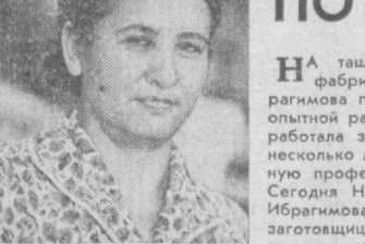
М. ГОЛТВЕРК. Соб. корр. «Правды Востока».

По предложению и советам таджикских хлопководов принимаются конкретные меры: немедленно устраняются недостатки.