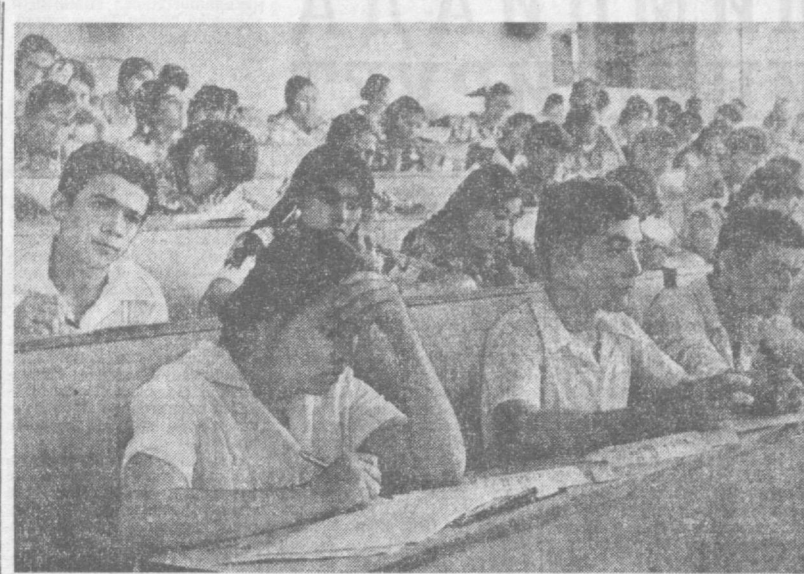
В Узбекистане, как и во всей стране, 1 августа начались вступительные экзамены в высших учебных заведениях. На снимке: группа абитуриентов сдает экзамены в Ташкентском государственном университете имени В. И. Ленина.

Есть трудности и со строительством. Наши подразделения — Министерство строительства и Министерство сельского строительства — выполняют план сдачи новых промышленных и культурно-бытовых объектов. А незавершенное строительство — тяжелое бремя. Проблемой стала и уборка урожая овощей и фруктов. Дорог каждый день, любая задержка может привести к гибели части урожая, а своими силами мы не справляемся. Нужна рабочая рука, нужна помощь.