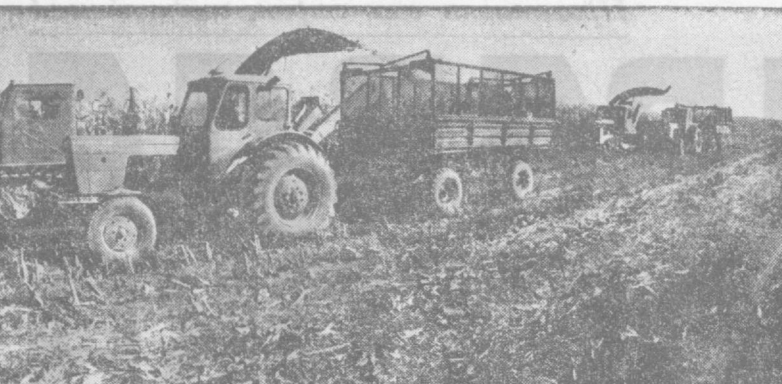
Уборку кукурузы на зерно ведут земледельцы совхоза «Комсомолец» Душанбинского района. Завершить ее решено за 15 рабочих дней. При плане 32 центнера с гектара намечено получить на круг по 70 центнеров с площади 340 гектаров. На снимке: идет механизированная уборка кукурузы.