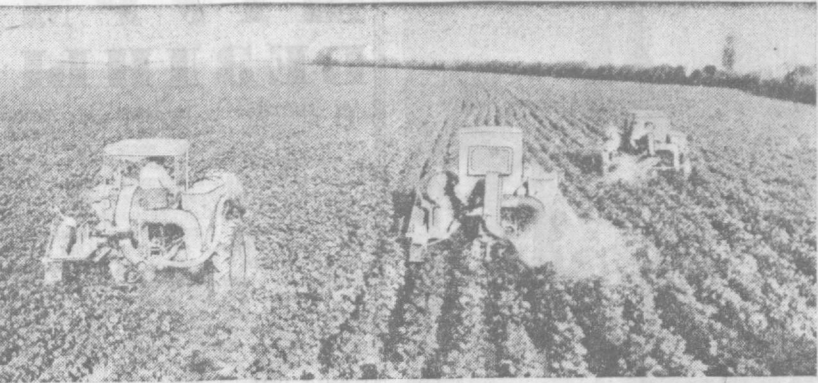
На полях хозяйства есть где развернуться машинам. Капитальная планировка, проведенная недавно, позволила укрупнить карты, удлинить гонги, что повысило экономичность использования техники. Сейчас она является на полях колхоза полноластной хозяйкой, а гвардейцы поля взяли на свои плечи главную заботу о выращивании «белого золота». Идет обработка хлопчатника ядохимикатами на полях передовой бригады № 4. Хлопкоробы уверены: сельхоззрелости на картах не будет.