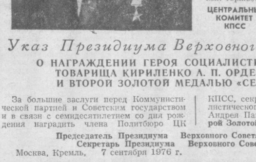
Товарищу КИРИЛЕНКО Андрею Павловичу

Товарищ Л. И. Брежнев пожелал молодой республике успехов в строительстве народно-демократического строя, в закладывая основы социалистического общества. Он подчеркнул важное значение международной деятельности НРПЛ, о задачах, вставших перед партией после победы национально-демократической революции и общинации республики.