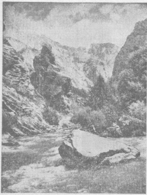
Богата и разнообразна природа нашего края. Сколько в ней привлекательных уголков. Вот один из них — Конусское ущелье.