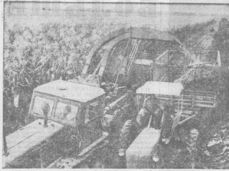
Первыми в Хорезмской области начали убирать урожай кукурузы труженники колхоза имени XIX партсъезда Шахского района. Зерноводы хозяйства, поддерживая почин кубанцев, дали слово сдать в закрома государства в минувшую страду по 100 центнеров зерна кукурузы с каждого из 83 гектаров. На снимке: уборка полей.