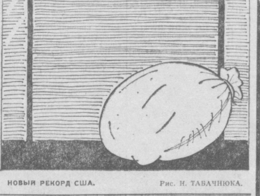
НОВЫЙ РЕКОРД США. Рис. И. ТАБАЧНИКА.

Тесными узами дружбы связаны с братской Болгарией коллективы многих предприятий, колхозов, совхозов, научных учреждений и учебных заведений Узбекистана. Ташкентцы и анджийцы называют себя братьями труженников Хасковско-Ямболского округов. В заводских цехах и на колхозных полях друзья обмениваются опытом. Едут друг к другу специальные делегации, туристические группы. Обо всем этом, о своем стремлении непрерывно крепить и развивать дружбу заявили участники состоявшихся по многим трудовым коллективам республиканских вечеров и собраний, посвященных 32-й годовщине социалистической революции в Болгарии — Дню свободы.