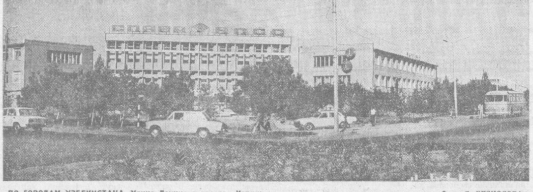
ПО ГОРОДАМ УЗБЕКИСТАНА. Улица Ленина в городе Карши.

РЕСПУБЛИКА ОТ КРАЯ И ДО КРАЯ КРУПНЕЙШАЯ В КАРАКАЛПАКИИ НУКУС. (Соб. корр.). Принято решение о строительстве Нукусской межрайонной базы «Усельхозтехники», что будет самым крупным в автономной республике комплексом по производству сельскохозяйственных машин, механизмов, прицепных орудий и запасных частей.