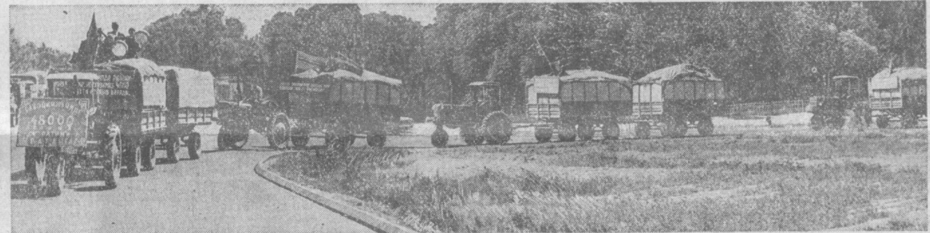
Стало доброй традицией первые тонны собранного хлопка отправлять на приемные пункты с музыкой. Первый «красный обоз» — всегда праздник для хлопководов. Этот снимок сделан несколько дней назад в Бухарском районе.