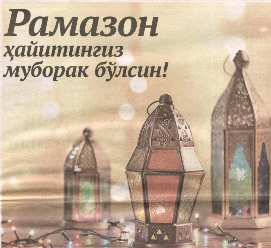
» Долзарб мавзу