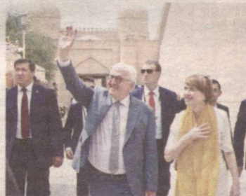
» Маданий алоқалар