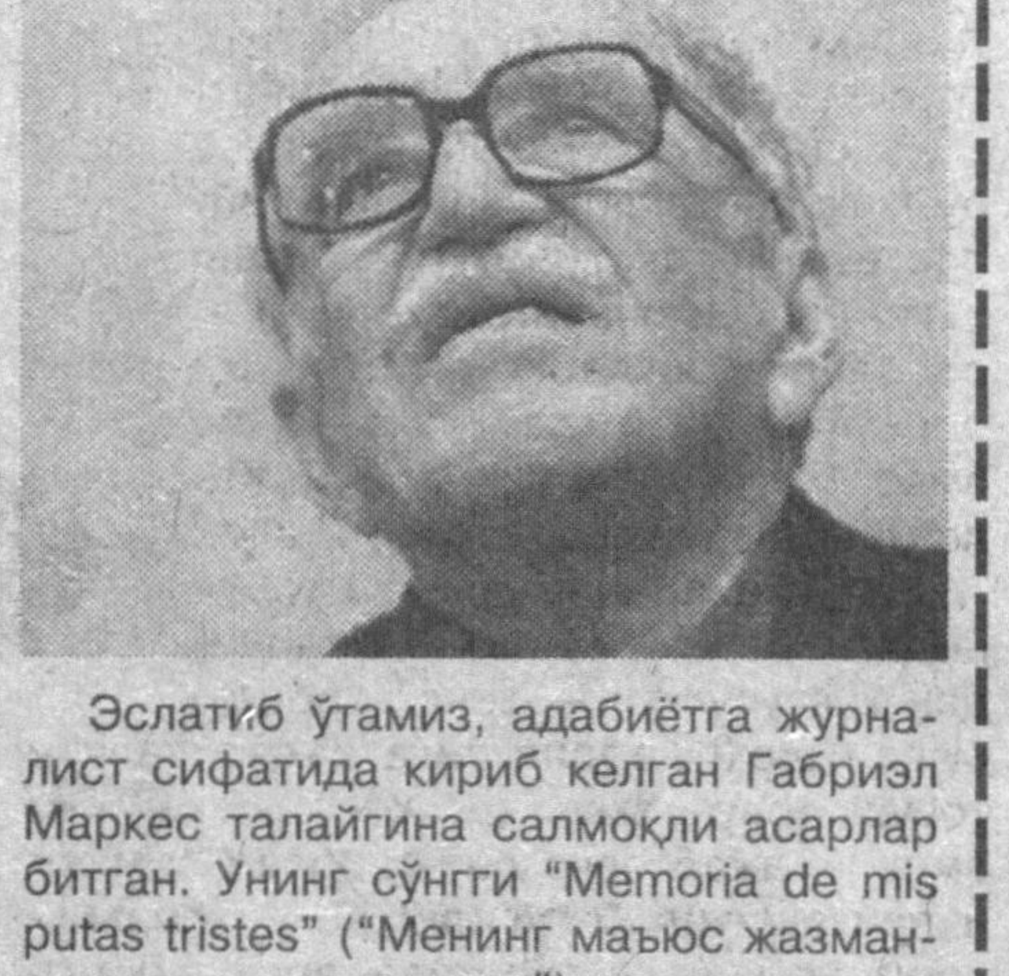
Эслатиб ўтамиз, адабиётга журналист сифатида кириб келган Габриэл Маркес талайгина салмоқли асарлар битган. Унинг сўнги «Memoria de mis putas tristes» («Менинг маъносиз жазмаларим ҳақида хотира») номли романи 2004 йили чоп этилган.

«Елғизликнинг юз йилги» асари муаллифи, адабиёт бўйича Нобел мукофоти лауреати Габриэл Гарсиа Маркес дунёдаги энг зўр ва керакли касб журналистика дея таъкидлади, деб хабар беради France Presse ахборот агентлиги.