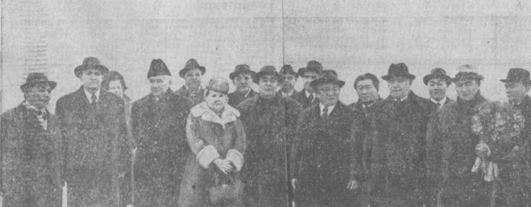
Проводы на аэродроме.

А. Хаммер выразил согласие с этой точкой зрения и отметил, что в американских деловых кругах существует желание расширить торговлю и другие формы экономических связей с Советским Союзом. Беседа прошла в деловой и дружественной атмосфере. В беседе принимал участие помощник Генерального секретаря ЦК КПСС А. М. Александров.