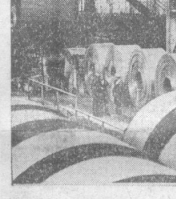
Отлично трудится коллектив страды хвойного проката «1700» на Карагандинском металлургическом комбинате. Почти вся продукция — отдухи высокого качества. Сейчас потребители более 300 предприятий страны получают карагандинский лист высшего сорта. На снимке: продукция страды хвойного проката «1700».