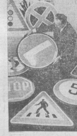
Производственное объединение «Спутник» ЦК ДОСААФ Латвии по заказу ГАИ страны изготавливает объемные дорожные знаки с внутренним освещением. Сделаны они из синтетических материалов, удобны в эксплуатации. На снимке: объемные дорожные знаки осматривает бригадир участка осветительной арматуры М. Мейстерс.