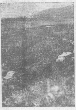
На три тысячи километров протянулась Колымская автотрасса. На ее долю приходится 97 процентов всех грузовых перевозок Магаданской области. На снимке: машины на Колымской автотрассе.