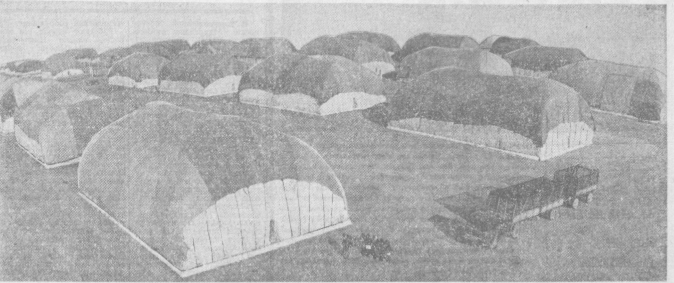
Это лишь малая часть большого хранима Самарканда.

Одержанная победа — результат героического труда колхозников, рабочих совхозов, специалистов сельского и водного хозяйства, большой целеустремленной организаторской и политической работы партийных, советских, профсоюзных и комсомольских организаций.