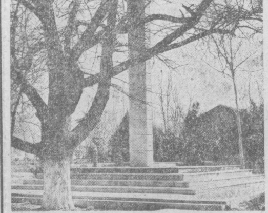
по ГОРОДАМ УЗБЕКИСТАНА. Джизак. Памятник борцам за Советскую власть.