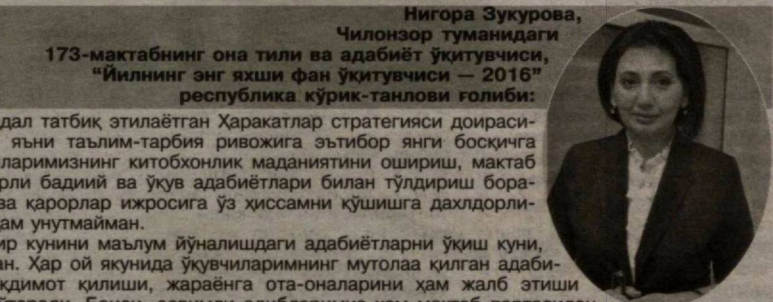
Нигора Зукурова, Чилонзор туманидаги 173-мактабнинг она тили ва адабиёт ўқитувчиси, “Йилнинг энг яхши фан ўқитувчиси — 2016” республика кўрик-танлови ғолиби:

— “Халқ билан мулоқот ва инсон манфаатлари йили”-да халқимизнинг хоҳиш-истаклари инобатга олиниб, мактабларда 10-синфлар ташкил этилгани, балоғат ёшидаги ўқувчиларнинг таълим-тарбиясида ўқитувчи салоҳияти катта ўрин тутуши таъкидлангани бизга билдирилган юксак ишонч ва масъулиятдан дарак. Педагог шахсига ишонч яқиндагина Президентимизнинг БМТ Бош Ассамблеясининг 72-сессиясидаги нутқида ҳам акс этди. Яъни, дунёдаги глобал муаммолар сабабини бартараф этиш билан бир қаторда ёш авлоднинг онгу тафаккурини маърифат асосида шакллантириш ва тарбиялаш энг муҳим вазифа экани таъкидланди. Айни йўналишдаги ишларни тизимли олиб бориш эса ўқитувчилардан фидойилик талаб этади. Шу мақсадда мактабимизда ўқувчиларнинг бўш вақтини самарали ташкил этиш учун спорт ва фан тўғралакларини ташкил этганмиз. Бўш вақтида фойдали ишлар билан шуғулланган ўқувчиларимиз эса фанларни аъло баҳоларга ўзлаштириб, намунали хулқи билан тенгдошларига ибрat бўлмоқда. Бу борадаги ишларимизни жонлантириш, янги тажрибаларни яратиш учун ёш мутахассис сифатида доимо изланишга тайёрман.