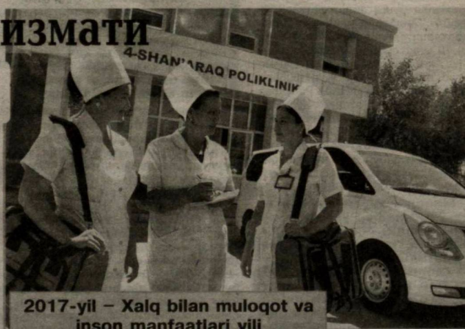
2017-yil — Xalq bilan muluqot va inson manfaatlarini yili