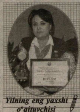
Йилнинг энг яхши о'қитувчиси

— Ҳар бир дарсни бошлашдан олдин ўзимга устозим бу