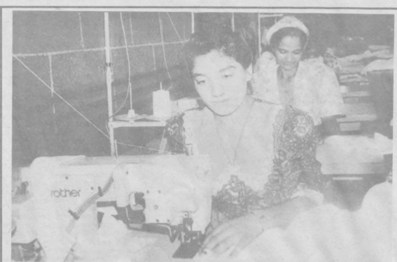
Чеварлик ўзбек қизлари учун яхши фазилат, момоларидан қолган мерос. У ҳозирги пайтда замонавий техника билан уйғуллашиб, янада катта мазмун ва моҳият касб этмоқда.

Мен иккинчи жаҳон урушининг азоби ўқубатларини бошидан ўтказганман. Уруш бошлангандан то охиригача фронтларда жанг қилдим. Урушдан биринчи гуруҳ ногирон бўлиб қайтдим.