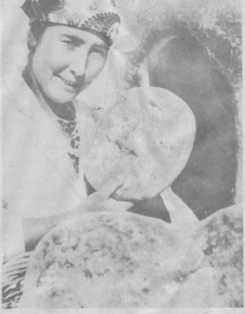
Нонлар... Седанали, жиқзали, паатир нонлар. Юртимиз тўқинчилиги рамзи, дастурхонлар қўрғи, кўнгиллар тўқинчи, миллатимиз ифтихори, халқимиз ризқ насибаси. Унда халқимизнинг неча асрлик пандоначилиқ маҳорати ўз аксини топган.

«Ўзбектеелефильм» студияси ижодий жамоаси кейинги йилларда тарихий мавзуларда ҳам кўплаб фильмлар яратиб келмоқда, бу мамлакатимиз тарихини ўрганишда ёрқин уфларини очиб, тарихий ҳақиқатни билишда асос бўлиб хизмат қилмоқда.