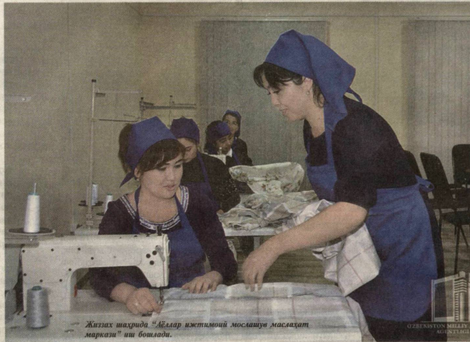
Жиззах шаҳрида «Аёллар ижтимоий мослашув масалахат маркази» иш бошлади.

аҳоли даромадларини ошириш ва турмуш шароитини яхшилаш, қулай инвестиция муҳити яратиш ва янги sanoat тармоқларини ривожлантириш чоралари қўрилади.