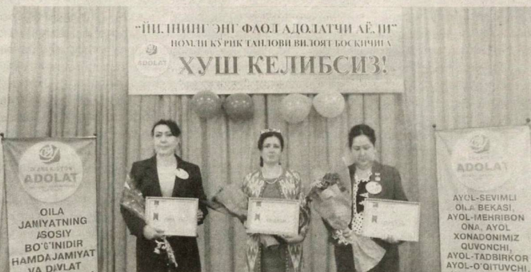
НАМАНГАН. Бугунги кунда жамиятимизда бўлгани каби партиямиз ҳаётида ҳам опа-сингилларимизнинг фаоллиги ошиб бормоқда. Улар партия ташкилотларимиз олиб бораётган тарғибот-ташвиқот ишларига ўзларининг муносиб ҳиссаларини қўшиб келмоқдалар.

Жамият ҳаётида хотин-қизларнинг мавқеини ошириш, уларга ўз иқтидори, интеллектуал салоҳиятини намоён этишга имкон яратиш ва ташаббусларини қўллаб-қувватлаш Ўзбекистон "Адолат" социал-демократик партиясининг устувор вазифаларидан бири саналади. Партия тизмида анъанавий ўтказиб келинаётган "Йилнинг энг фаол адолатчи аёли" республика кўрик-танловининг бу йилги ҳудудий босқичида ҳам ана шу муҳим жиҳатлар ўз амалий ифодасини топди.