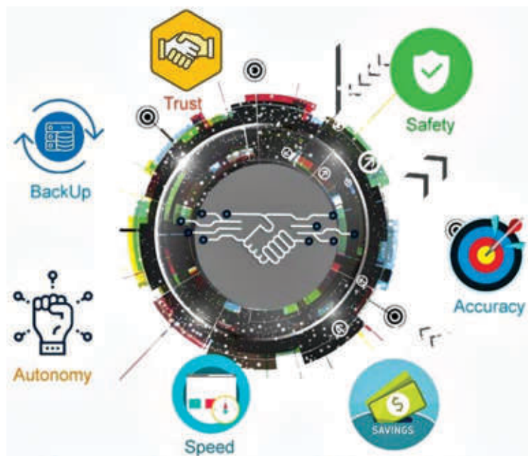
Smart Contracts of Blockchain

Президентимизнинг 2018 йил 3 июлдаги “Ўзбекистон Республикасида рақамли иқтисодиётни ривожлантириш чора-тадбирлари тўғрисида”ги қарорида инвестициявий ва тадбиркорлик фаолиятининг турли шаклларини диверсификация қилиш учун криптоактивлар айланмаси соҳасидаги фаолиятни, жумладан, майнинг, смарт шартнома (рақамли транзакцияларни автоматик тартибда амалга ошириш орқали ҳуқуқ ва мажбуриятлар бажарилишини назарда тутувчи электрон шаклдаги шартнома), консалтинг, эмиссия, айирбошлаш, сақлаш, тақсимлаш, бошқариш, суғурталаш, краудфандинг (жамоавий молиялаштириш), шунингдек, блокчейн технологияларни жорий этиш учун зарур ҳуқуқий базани яратиш каби вазифалар белгиланган эди. Бу эса мамлакатимизда рақамли иқтисодиётни ривожлантиришда смарт шартномалар фаолияти учун платформа бўладиган, блокчейн технологияларга оид муносабатларни тартибга солувчи нормаларни ишлаб чиқиш ва ақлли шартномалардан кенг фойдаланишни йўлга