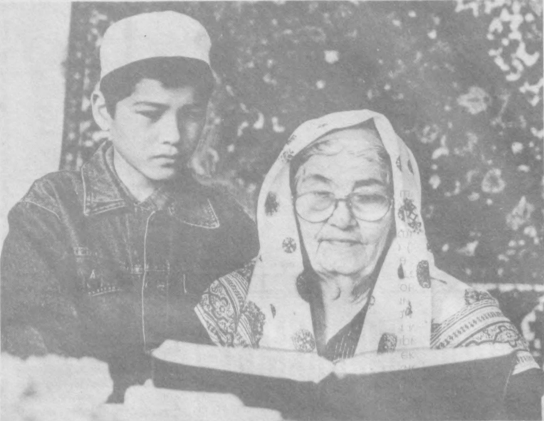
МЕН ҲАҚИЙИ...СЕН МАЪНОСИНИ УҚИБ ОЛ, БОЛАМ...