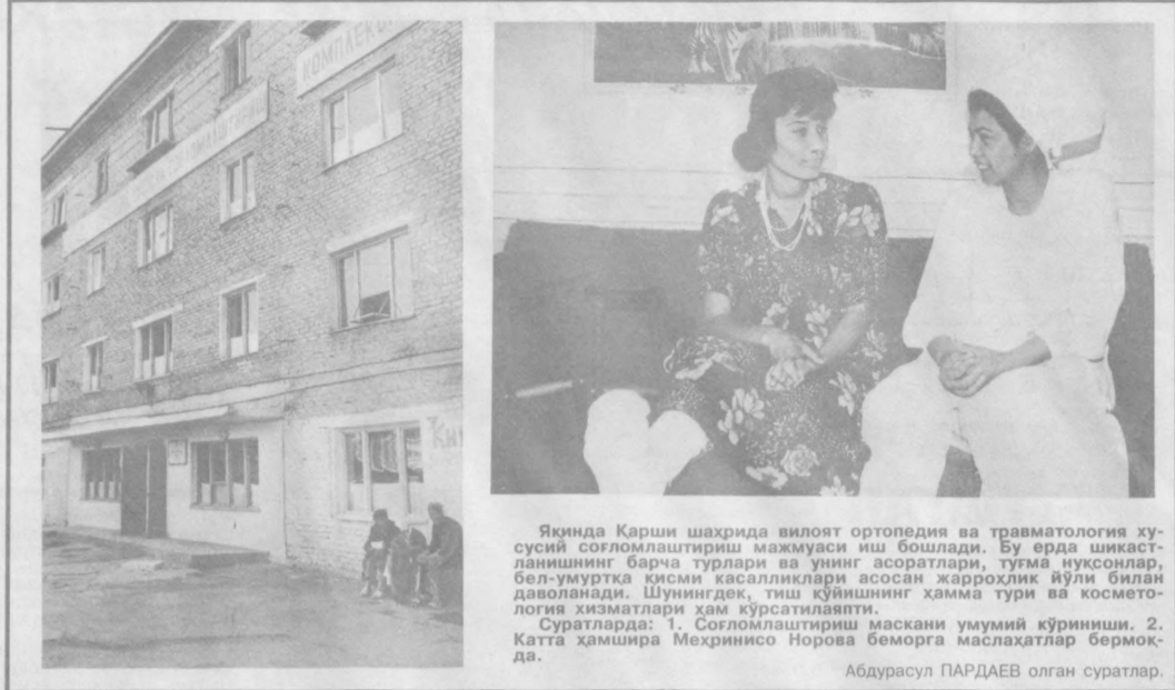
Яқинда Қарши шаҳрида вилоят ортопедия ва травматология хусусий соғломлаштириш мажмуаси иш бошлади...