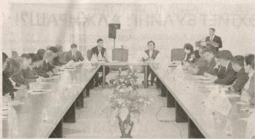
«Давоми. Бошланиши 1-бетда».

Йиғилишда қайд этилганидек, халқ депутатлари Ангрен, Олмалик шаҳар ва Ўқма туман Кенгашидаги 4 нафар депутат партия ташкилотлари билан алоқани узгани, сайловчилар ишончини оқламагани сабабли мuddатидан олдин қақриб олинди. Ангрен шаҳар, Чиноз, Зангиота, Оҳангарон туманларидаги айрим депутатлар эса фаолияти сустлиги боис огоҳлантилди.