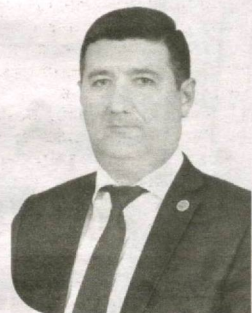
Абдулла РЎЗМЕТОВ, Олий Мажлис Қонунчилик палатаси депутати, O'zLiDeP фракцияси аъзоси

Давлатимиз раҳбари, ўзаро ҳамкорликни кучайтириш, аҳилликни мустаҳкамлаш зарурлигини қайд этаркан, бу борада қатор таклифларни