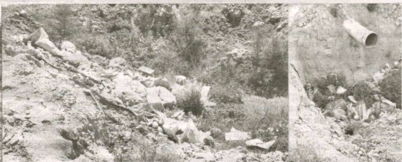
Ғишт ишлаб чиқариш жараёнида айрим ҳудудлар саноат ва маиший чиқиндилар билан ифлосланяпти.