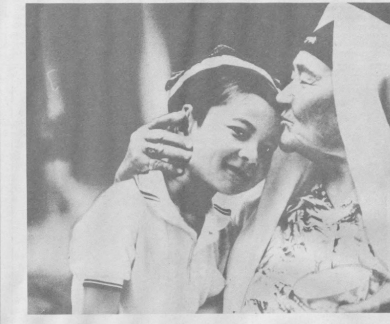
Саволга замондошларимиз фаолияти, турмуши ёрқин жавобдир!