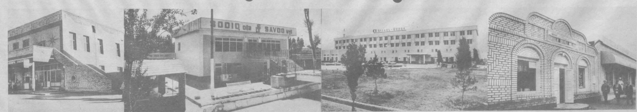
Вилоят шаҳар ва туманларида кад ростилаётган мустақиллик иншоотлари кун сайин кўпайиб бормоқда.

— Илгари қишлоғимизда бирорта ҳам тиббий муолажа маскани йўқ эди. Бирор дард билан оғриб келган кишилар узок йул босиб, туман марказига боришарди. Эндиликда истиқлол туфайли қишлоғимиз аҳолиси янги курилган тиббий муолажа маскани хизматларидан беминнат фойдаланмоқдалар. Бизга бундай қулайликларни ато қилган Мустақиллигимизнинг умри боқий булаверсин.