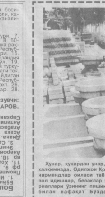
Хунар, хунардан унар, деган мақол бор халқимизда. Одиложон Кодиров бошлик хунармандлар оиласи таъридан турли сопол идишлар, безаклар ва қурилиш материаллари ўзининг пишиқлиги, қўрқамлиги билан нафақат Бўзда, хатто бошқа жойларда ҳам эътиборга тушган. Суратда: Одиложон ака Кодиров ўғли Дилшодбек ва уста Илхомжон Баратов билан буюртмаларнинг бажарилиши хусусида суҳбатлашмоқда.

сиядаги шаҳар. 22. Атмосфера босимини ўлчайдиган асбоб. 26. Торли, қамонли соз. 27. «Бешлар» телеканалдаги курсатувлардан бири. Энига: 3. Худ-худ. 6. Ширинлик тури. 7. Қадимги Римда ов маъбудаси. 8. 60-йилларда машҳур бўлган Америка рақси. 12. Хайвон қасаллиги. 13. Республикада машинасозлар шаҳри. 15. Ўзбек шоири хаттоти. 16. Исландия эвузчиси. 17. Канададаги қул. 19. Пайғамбарлардан бири. 21. Суз туркуми. 23. Сурия ва Ливан ўртасидаги тоғ. 24. Азалдан бир жойда яшайдиган хайвонларнинг мажмуъаси. 25. Республикада кенг тарқалган дарахт. 26. Толдикўрғон вилоятдаги шаҳар. 28. Пайвандлаш усули. Тузувчи: Тожиали УМАРОВ.