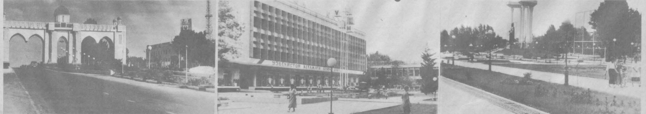
Мустақиллик йилларида вилоят шаҳар ва кишлоқлари янада кўркاملлашиб, ўзгача чирой ва жозиблага эга бўлди.

Саҳифани журналист О. НОМОЗОВ тайёрлади.