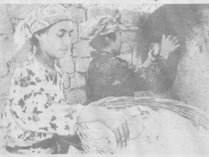
Тандир тўлиб ёпилди нон. Т. Мирзақаримов сурат-лавҳаси.