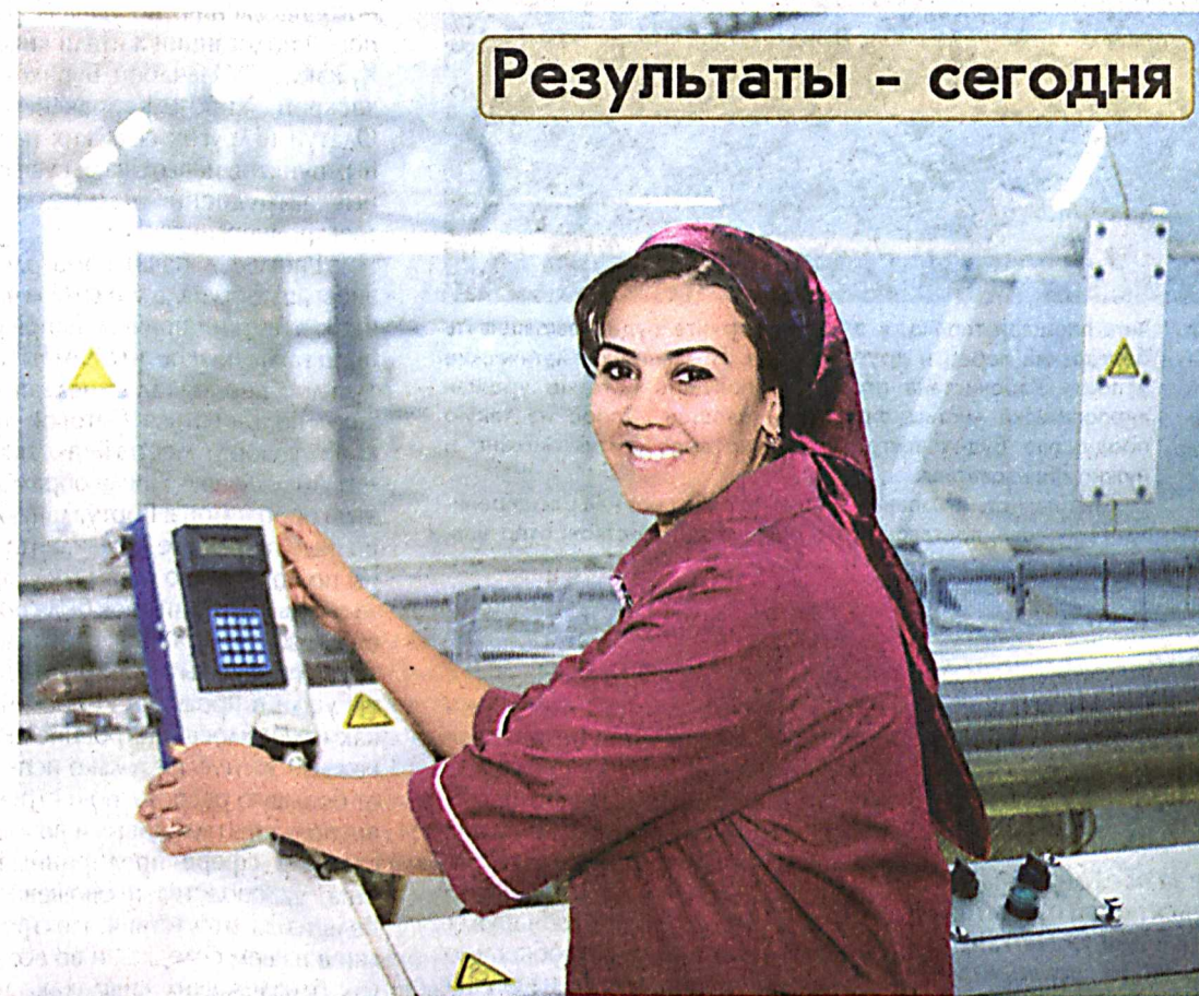
Результаты - сегодня

Производимый в нашей стране шелк благодаря высокому качеству пользуется большим спросом как у соотечественников, так и на мировом рынке. Предприятие "Бухара бриллиант силк", созданное совместно с китайскими партнерами в 2010 году, специализируется на выпуске экспортноориентированной шелковой пряжи и тканей. В рамках программы модернизации производства успешно осуществили оснащение предприятия современной техноло-