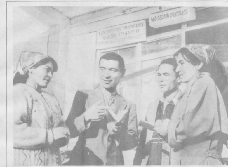
Чортоқ туманидаги Айқирон қишлоғи марказидаги 460-сайлов участкасида сайловолди ташвиқот ишлари намунали олиб борилмоқда.