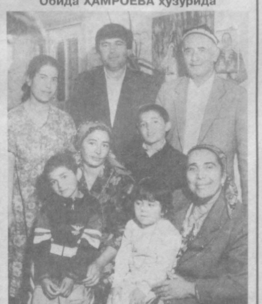
Шундай қаҳрамонлар учрайдики, улар маълум бир вақт — даврда шон-шухрат қозониб, газета-журналлар саҳифасидан тўшайди, ҳатто, улар ҳақида китоблар ёзилади, фильмлар яратилади. Аммо, ҳаёт деб аталмиш улкан уммоннинг ўз қонунилари, тизгинисиз, асов галабелари борки, охири-охирида ҳаммамиз вақтининг ҳукмига бўйсунамиз. Чунки вақт кўтмайди, ҳеч қачон бир жойда тўхтаб қолмайди. Ҳар бир кун, ҳар йилнинг ўз қаҳрамонлари тугилади, янги