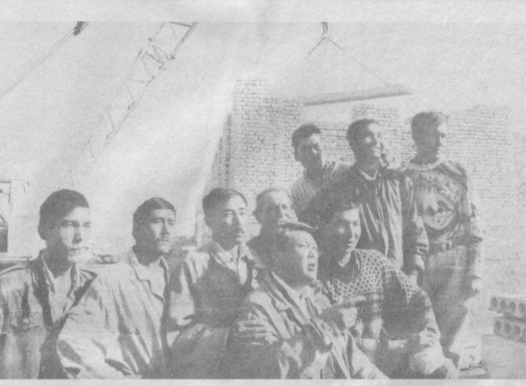
Истиқлол иншоотлари қад кўтармоқда... СУРАТДА: Қорақалпоғистоннинг «Қирққиз» кўчма механизациялашган жамламаси аъзолари.

Ўзбекистон Бадий Академиясида мамлакат Президентлиги сайловида Ислон Каримов номзодини қўллаб-қувватлашга бағишланган учрашув бўлиб ўтди. Бадий академия раиси Т. Қўзиёев учрашувни очар экан, ушбу сайлов XXI аср бўсағасида халқимиз ҳаётидаги улкан воқеа бўлишини қайд этди. Юрт келажаги ва эл фаровонлигини таъминлаш, чинакам ҳуқуқий демократик давлат ва фуқаролик жамятини барпо этиш, миллий ва умумбашарий қадриятларни қарор топтириш, маданият ва санъат