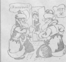
Я первый! Нет! Я!