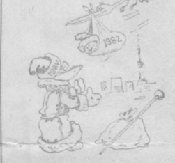
Рис. А. САФРОНОВА.