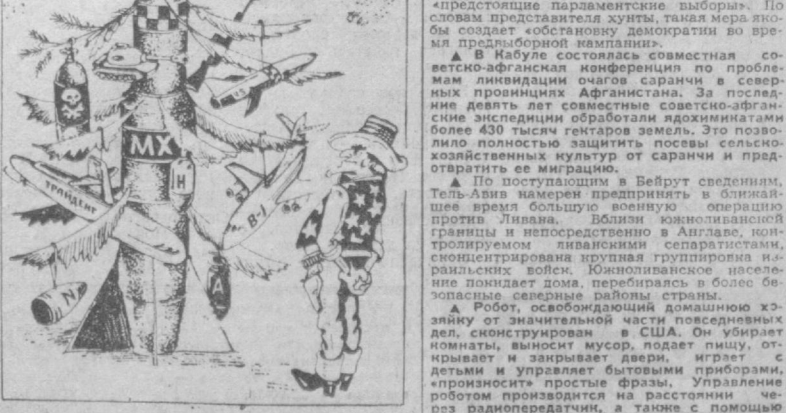
«Новогодняя елка» Вашингтона. Рис. А. САФРОНОВА.

В новом 1982 году Соединенные Штаты запланировали беспрецедентный рост ядерных и обычных вооружений. Конгресс США утвердил военный бюджет в сумме около 200 млрд. долларов. (Из газет).