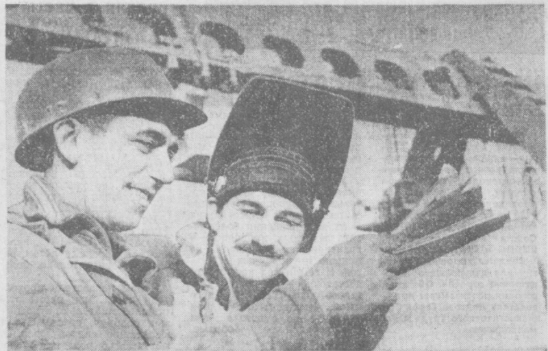
Хороший старт в новом году взяли строители Ташкентского метрополитена. Ударно трудятся коллективы на сооружении второй очереди первой в Средней Азии «подземки». На

Доведена до проектной отметки плотина еще одного водохранилища в Ургутском районе — Караталсайского. Здесь к новому сезону поливов намечено накопить 19 миллионов кубометров влаги. Она орошит тысячи гектаров садов, овошных и виноградных плантаций в Самаркандском и Ургутском районах. (УзТАГ).