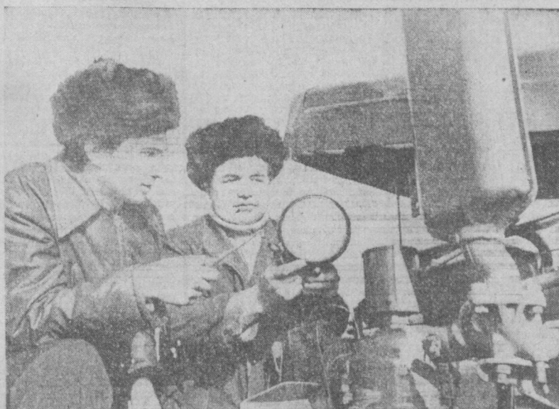
Высокими темпами ведет капитальный ремонт пропашных тракторов коллектив Среднеазиатских районных специализированных мастерских Госкомсельхозтехники. К началу нового года для отправки в хозяйства было подготовлено более тысячи ста машин. Сегодня в цехах предприятия идет напряженная работа.