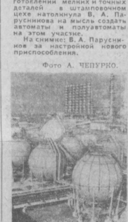
Широкое распространение получило в Нижнекамском районе под лозунгом «Лучших специалистов — на пусковые производства». Только на предприятиях местечка и энергетике около двух с половиной тысяч опытных, квалифицированных рабочих и инженерно-технических работников перешли во вновь организованные цехи. В результате почти на два третья мощность введенная в эксплуатацию в достой платиле, была освоена досрочно. На снимке: рабочий «Нижнекамскстехима».