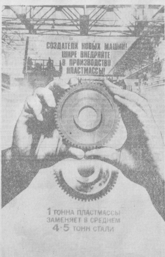
Плакат художников В. Соколова и В. Корцекого (издательство «Планета»).

и горячих ветров. К концу одиннадцатой пятилетки саванновые роши продвинулись в глубь песчаных барханов еще на четверть гектаров. (VZTAI).