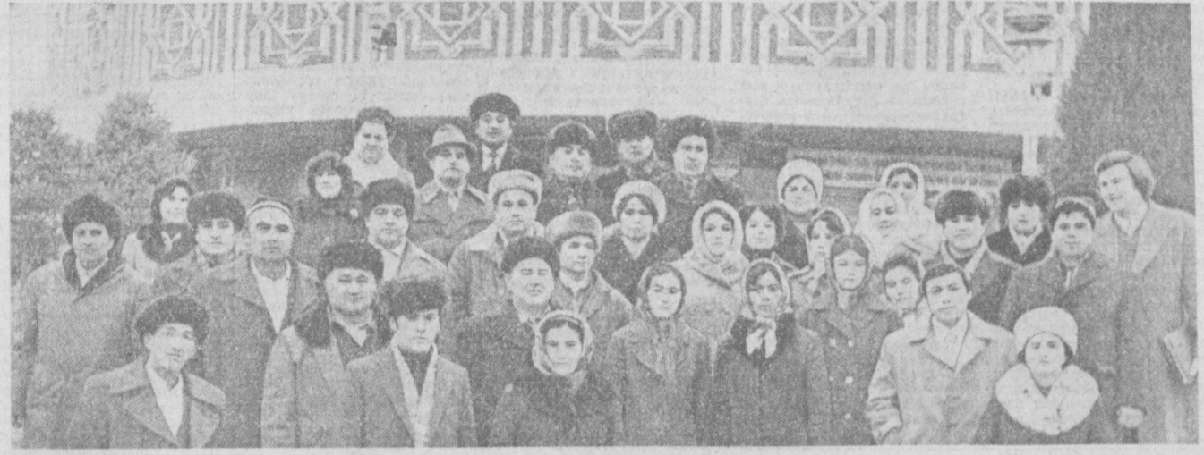
Сегодня открывается XII съезд профсоюзов Узбекистана. Для участия в его работе в столицу республики приехали передовики и новаторы производства, герои трудовых побед, лучшие представители творческой интеллигенции из Каракалпакской АССР и всех областей республики. Делегаты съезда уже побывали на «Ташсельмаше» и в швей-

И нет сомнения, что XII съезд профсоюзов Узбекистана наметит четкую программу дальнейшего улучшения работы, что профсоюзные организации республики и впредь будут надежными помощниками партии в работе по превращению в жизнь программы экономического и социального развития, разработанной XXVI съездом КПСС.