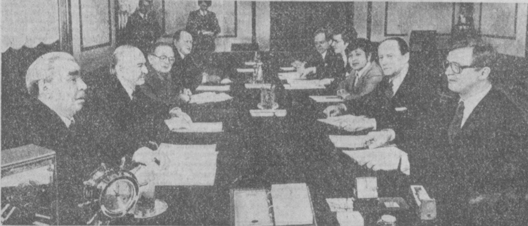
На снимке: во время беседы.