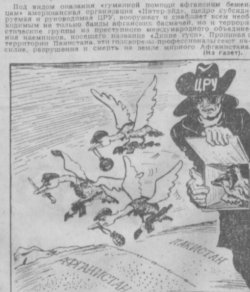
«Дикие гуси» с «фермы» ЦРУ. Рис. А. САФРОНОВА.