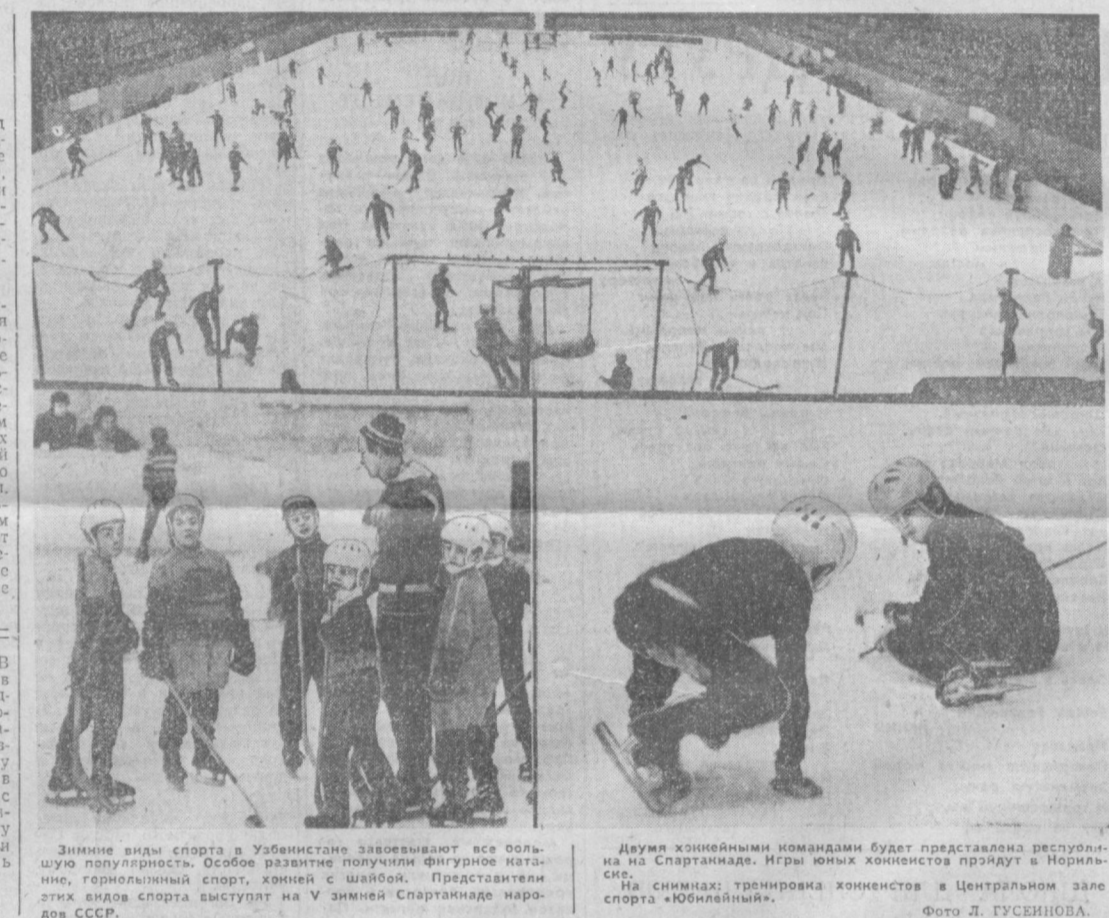
Зимние виды спорта в Узбекистане завоевывают все большую популярность. Особое развитие получили фигурное катание, горнолыжный спорт, хоккей с шайбой...