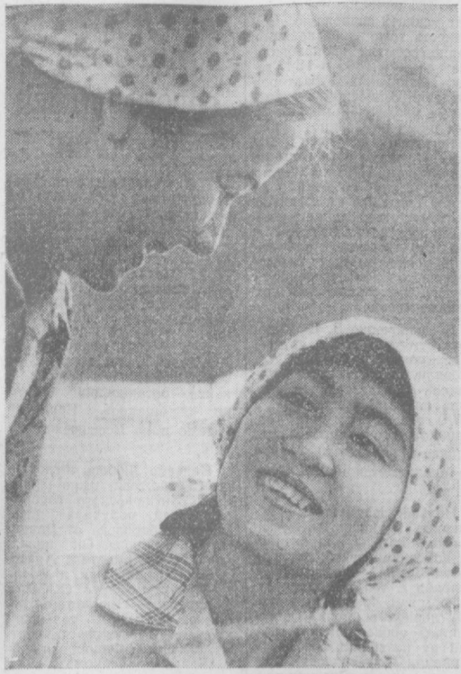
Многим молодым работницам дала путевку в профессию педагога швейного объединения «Красная заря»...