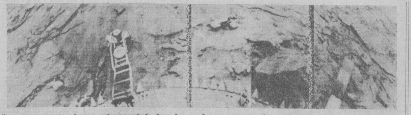
На снимках: государственный знак с изображением Герба Союза Советских Социалистических Республик, установленный на спускаемом аппарате станции «Венера-14». Панорама, полученная со спускаемого аппарата станции «Венера-14». (Фотохроника ТАСС).