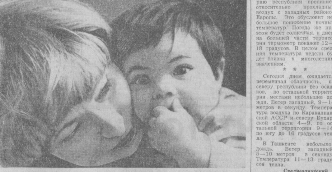
Нам нужен мир!

С программой из русских народных песен и плясок в амальгамском доме культуры «Спутник» дебютировал новый самодеятельный коллектив.