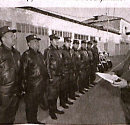
Мотопатруль дорожно-патрульной службы.

В столице вместе с патрульными машинами шести дивизионов функционируют десять мотопатрулей. Экспериментальная группа в основном обслуживает