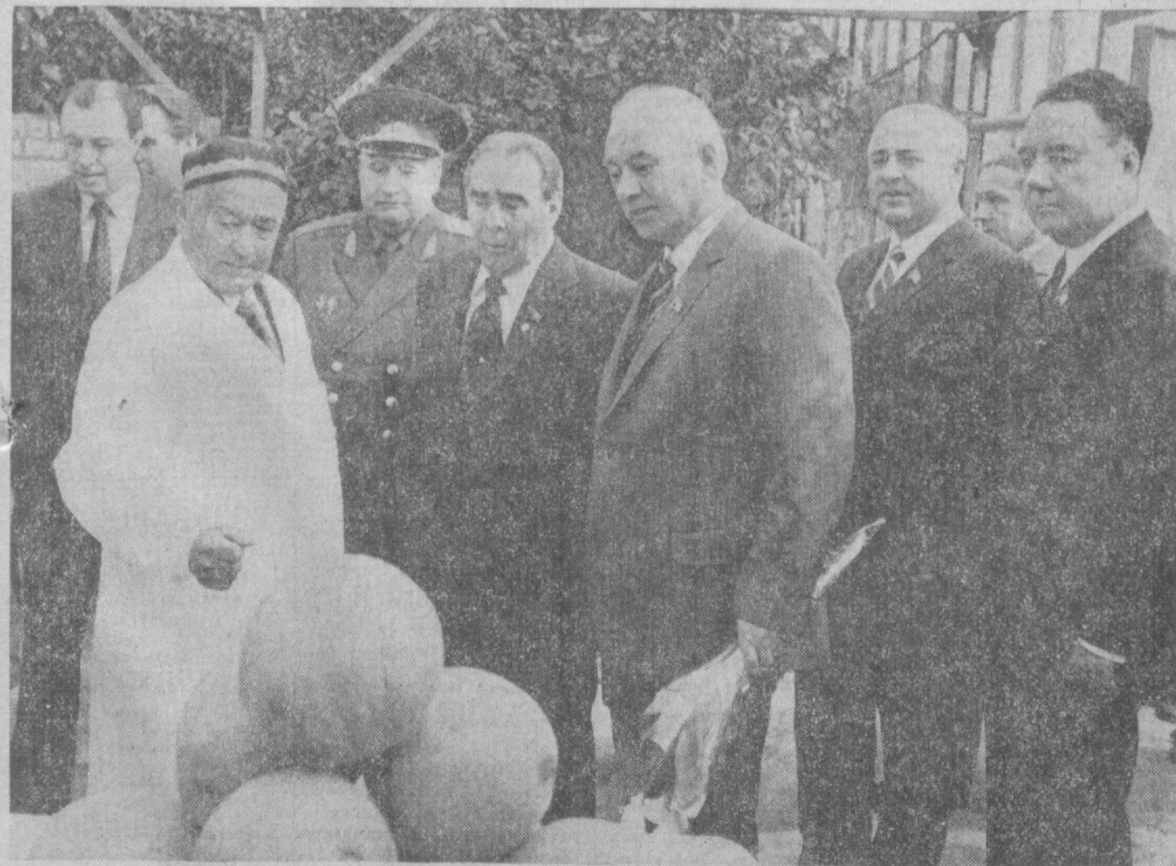
Л. И. Брежнев в лимонарии колхоза имени Ленина.