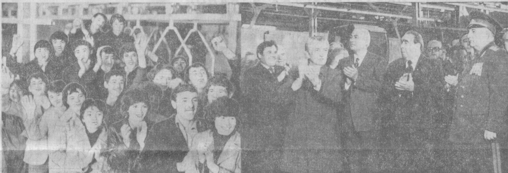
Встреча Л. И. Брежнева с рабочими Ташкентского тракторного завода.

Машины движутся по главной заводской аллее, их путь — к сборочному цеху. На площади перед гигантским корпусом развернута выставка техники, которую составляют на поля два крупнейших машиностро-