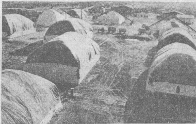
По 1.300 — 1.500 тонн хлопка принимает ежедневно от хозяйства района заготовительный пункт Хивинского хлопкозавода...