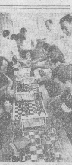
ТРУДИМСЯ, УЧИМСЯ, ОТДЫХАЕМ

и научно-технических отношений имеет Программа специализации и кооперации производства между ГДР и СССР на период до 1990 года.