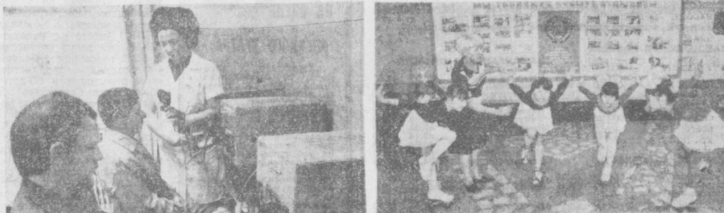
ТРУДИМСЯ, УЧИМСЯ, ОТДЫХАЕМ

Стал надеждой мира и труда Наш Союз — одна шестая света. Потому, что с нами навсегда: Ленини, Партия, Октябрь, Советы.