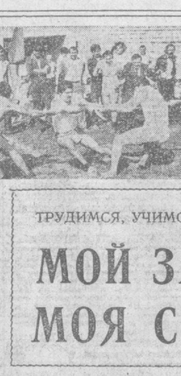
ТРУДИМСЯ, УЧИМСЯ, ОТДЫХАЕМ

с тем же периодом прошлого года промышленное товарное производство выросло на 4,2 процента, причем производительность труда возросла на 3,5 процента.