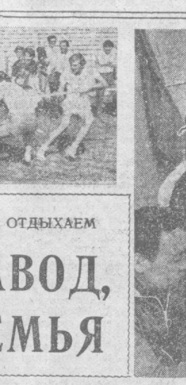
ТРУДИМСЯ, УЧИМСЯ, ОТДЫХАЕМ

и научно-технических отношений имеет Программа специализации и кооперации производства между ГДР и СССР на период до 1990 года.