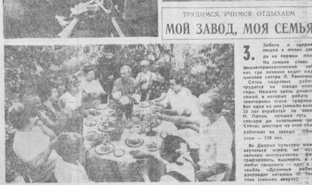
МОЙ ЗАВОД, МОЯ СЕМЬЯ