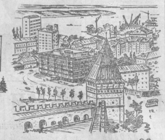
Эти рисунки сделаны художником И. Цыгановым в поездке по городам Волги. На рисунках в верхнем ряду: (слева направо) музей-мемориал В. И. Ленина в Ульяновске; Астрахань. Вид на город из кремля; в нижнем ряду: (слева направо) вид на реку Которосль в Ярославле; Горьковский кремль.