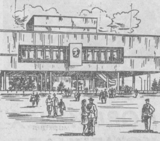
по Приволжским городам