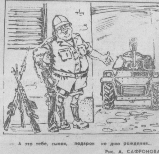
— А это тебе, сынок, подарок ко дню рождения... Рис. А. САФРОНОВА.

А. КУДИНОВ, Международный обозреватель «Правды Востока».