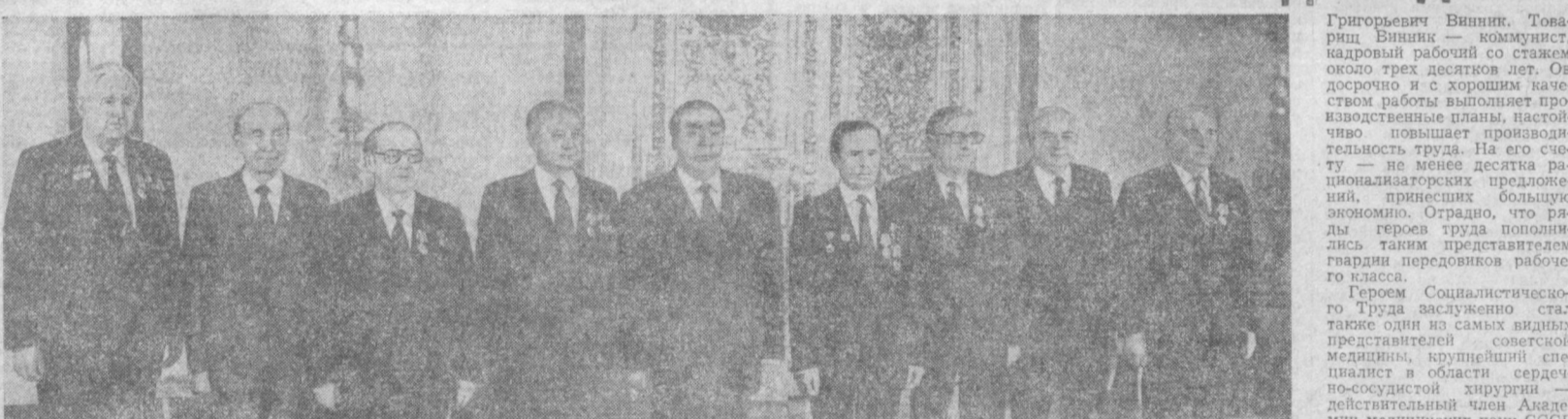
На снимке: при вручении наград.

Генеральный секретарь ЦК КПСС, Председатель Президиума Верховного Совета СССР Л. И. Брежнев вручил 2 ноября в Кремле члену Политбюро ЦК КПСС, Председателю Совета Министров СССР Н. А. Тихонову и группе других товарищей высшие награды Родины.