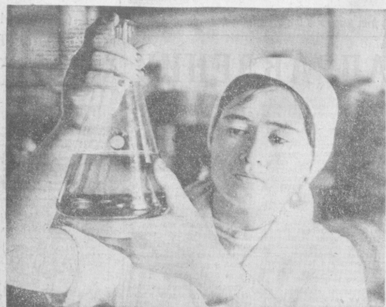
Ингиольский маслонирикомбинат изготавливает несколько видов изделий для народного потребления, а также продукцию для отхода скота. На комбинате производится замена в некоторых частях устаревшего технологического оборудования на новое, высокопроизводительное, дающее возможность улучшить качество продукции.