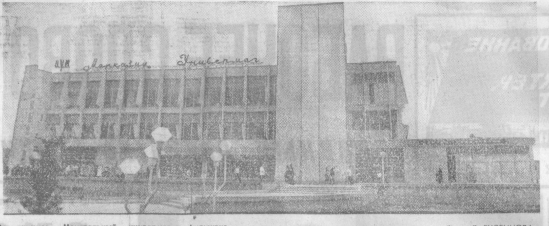
На снимке: Центральный универсам г. Андижана.

Упрямо гулял ленино на эффективное использование стадиона. Сказал «упрямо» и вспомнил про ослика Афанди. А может, не украл его? Просто забрал ишак на стадион, где в изобилии такое лакомство?