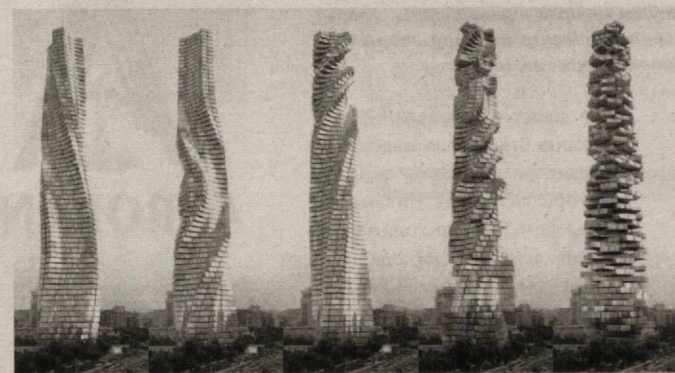
"Dynamic Tower" иншооти навбатдаги дунё мўъжизаларидан бирига айланиши мумкин. Бу бинони Дубайда қуриш мўлжалланган: у ўз шаклини ойнинг ҳолати ёки эгасининг хоҳиши ва кайфиятига қараб ўзгартира олади.

лойиҳалаштириладиган янги уйга шундай таъриф берилмоқда