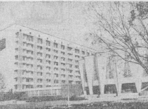
Более двадцати тысяч пациентов получили высококвалифицированную помощь в Ташкентском филиале Всесоюзного научного центра хирургии АМН СССР...