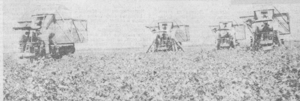
Одними из первых в Ленинском районе выполнили план хлопководства труженники целинного совхоза имени Ленина. В этом хозяйстве уделяли особое внимание применению хлопководной техники, что позволило досрочно выполнить план машинного сбора. На снимке: «голубые корабли» на поле совхоза имени Ленина.

Анализируя итоги своей работы в свете задач, выдвинутых товарищем Ю. В. Андроповым на ноябрьском (1982) пленуме ЦК КПСС, пленении УЧП Ленина ЦК Компартии Узбекистана, областной партийная организация намечает меры по дальнейшей интенсификации производства.