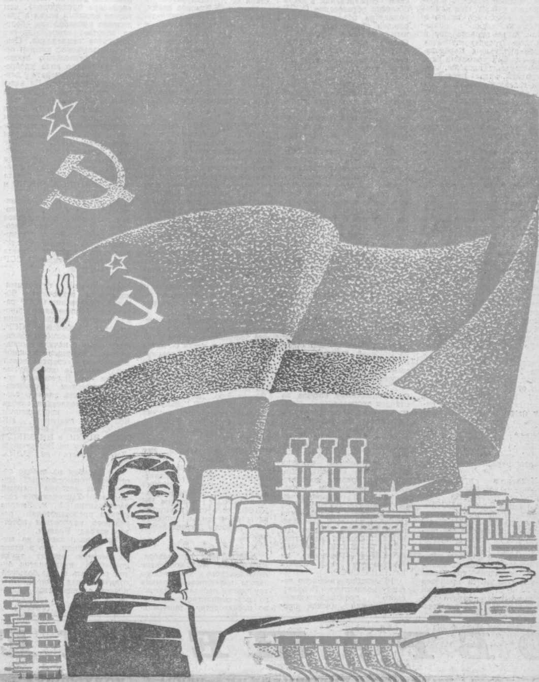
Плакат художника В. ЕВЕНКО.

Во имя мира во всем мире, во имя торжества коммунизма, на благо Родины умножают свои успехи в труде граждане Страны Советов. Свои достижения они посвящают 60-летию образования СССР, нерушимому союзу народов-братьев.